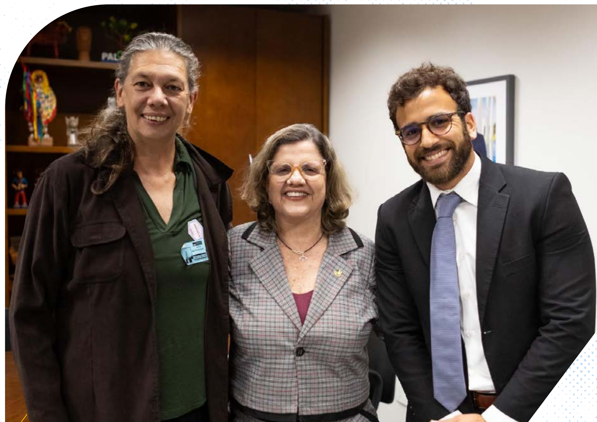
Reunião com a Sen. Teresa Leitão (PT-PE) presidente da Comissão de Educação do Senado Federal.

Esse avanço contribui para consolidar o esporte como elemento estruturante da política educacional brasileira.