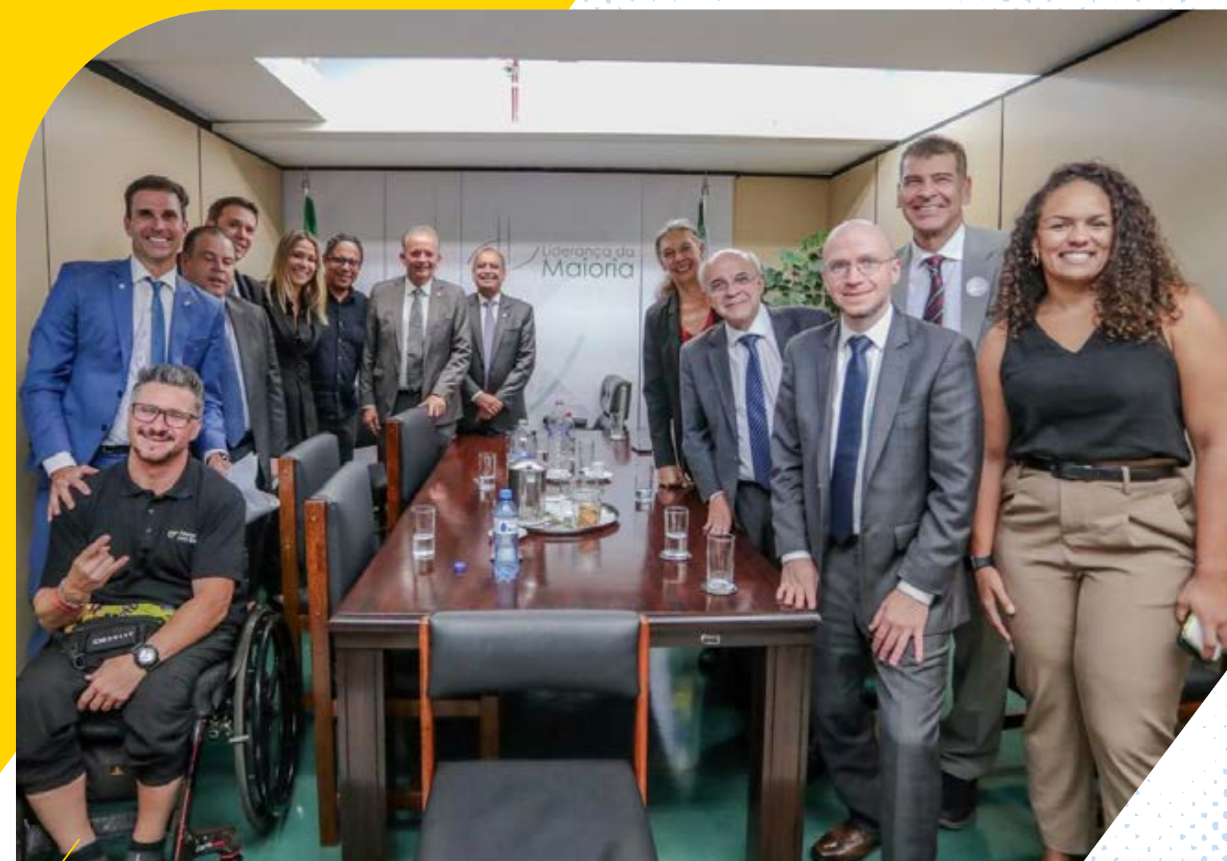
Comitiva da ApB em reunião com parlamentares, na liderança da Maioria da Câmara dos Deputados.