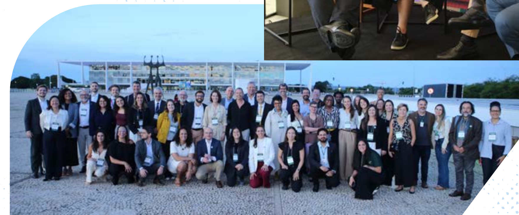
Registros do evento de lançamento da Agenda Sistêmica do Esporte, em Brasília.

o acesso e permanência ao esporte para o conjunto da população.