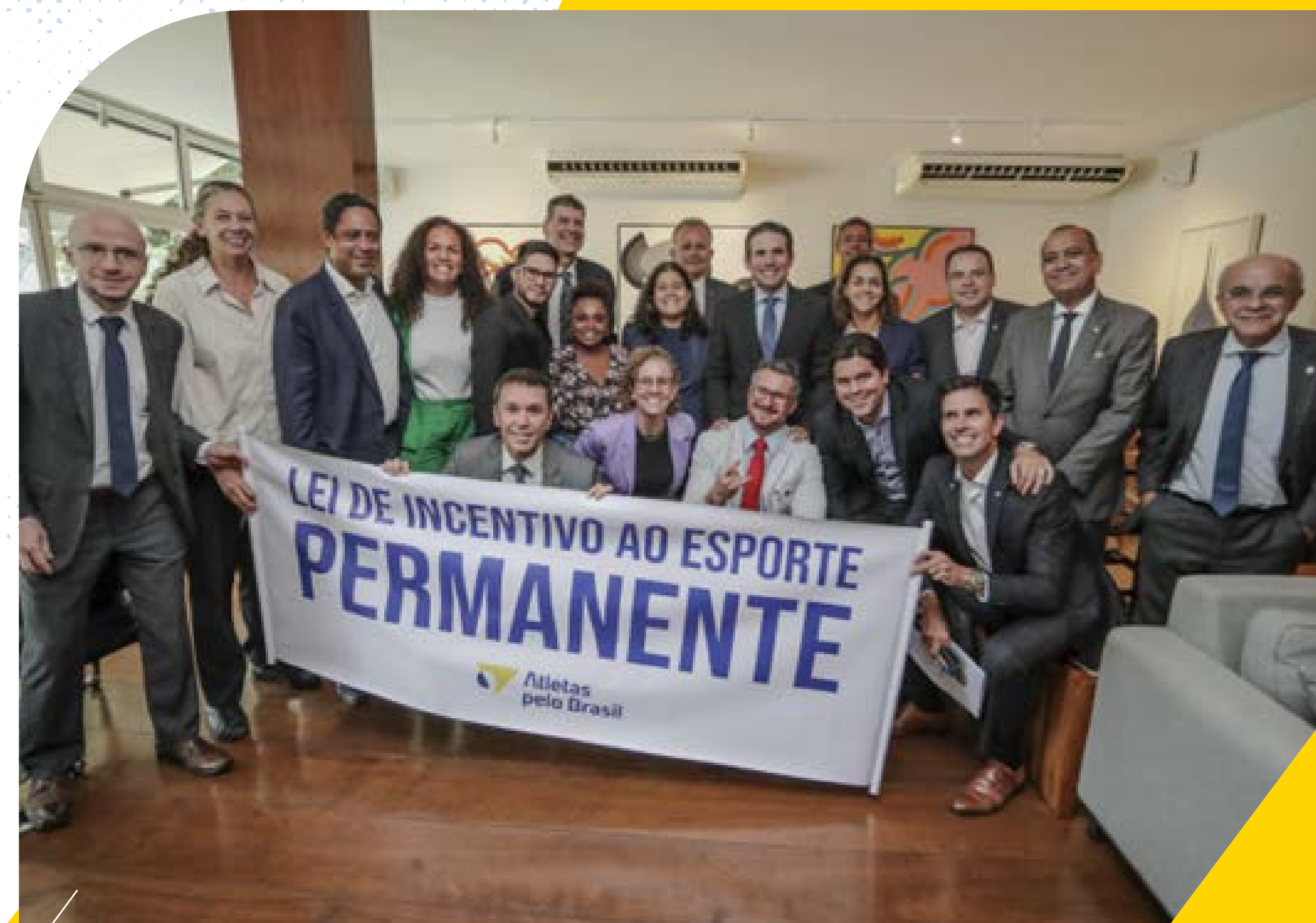
Reunião de comitiva da ApB com presidente da Câmara, Hugo Motta, parlamentares e Ministro do Esporte.

com um ofício assinado por mais de 450 organizações e 5 mil pessoas,