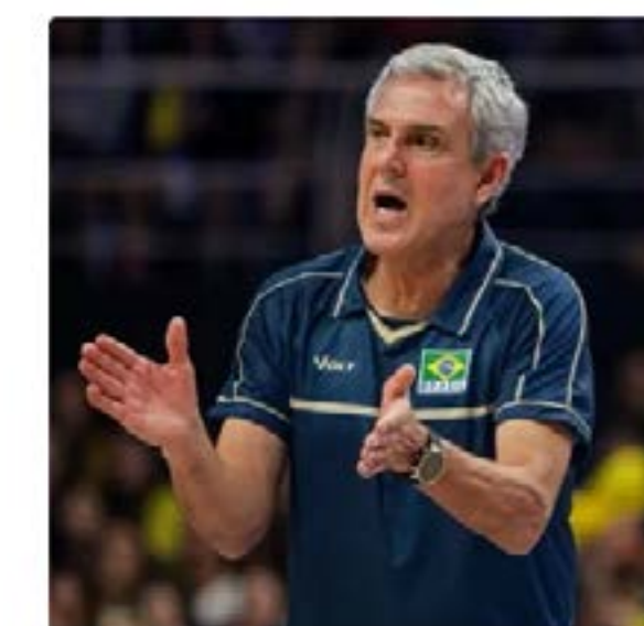
José Roberto Guimarães durante jogo da Liga das Nações, no Maracanãzinho

Atletas e entidades esportivas celebraram o Dia Olímpico, neste 23 de junho, com um pedido às autoridades. Mais de 5.500 nomes assinaram um ofício em que pedem que a Lei de Incentivo ao Esporte se torne permanente. O documento foi enviado ao presidente Lula e à Câmara dos Deputados.