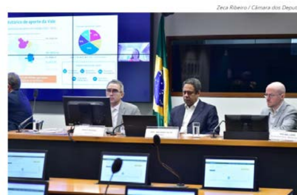
Reunião da Comissão Especial da Lei de Incentivo ao Esporte