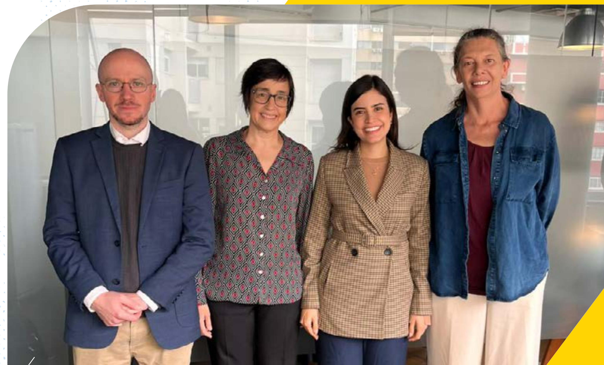
Reunião com a Dep. Tabata Amaral (PSB-SP), presidente da Comissão Especial do Plano Nacional de Educação.