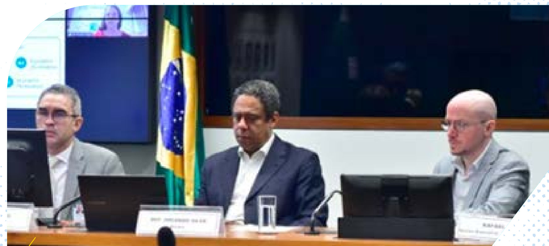
Participação da ApB na Audiência Pública da Comissão Especial